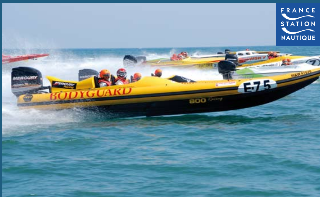
Chiffres de référence année 2010